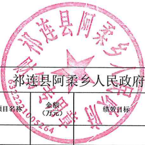
祁连县阿柔乡人民政府2023年部门预算项目支出绩效目标公开表