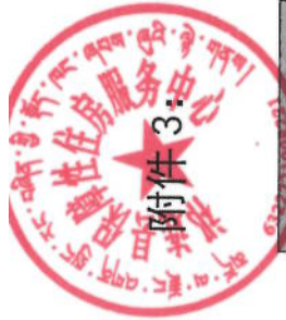
事前绩效评估评分指标体系明细表（祁连县游牧民进城定居小区配套基础设施建设项目）